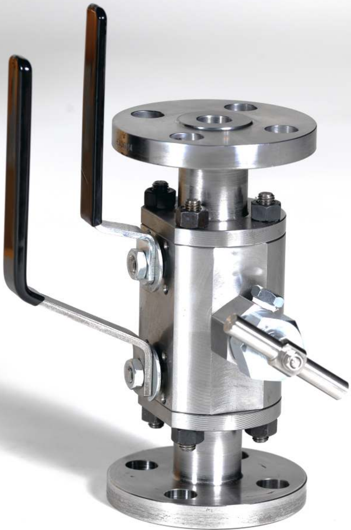
DOUBLE block and bleed